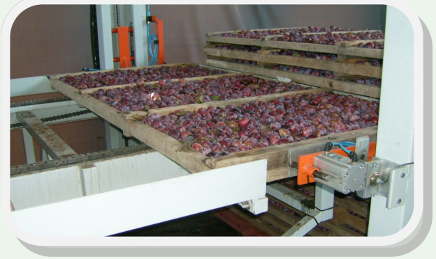
Líneas de llenado de bandejas